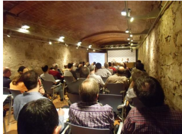
Ass. preparatòria de socis i sòcies de consum a Barcelona

Dades d'assistència: 162 assistents i 50 delegats socis/ delegades sòcies de consum.