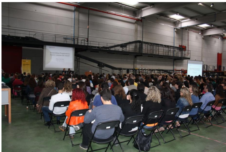
Assemblea preparatòria de socis i sòcies de treball a Vilanova del Camí