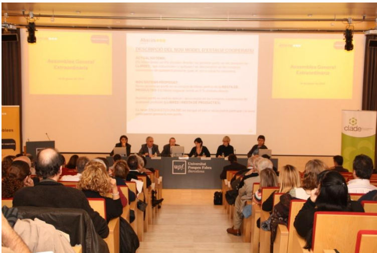
Assemblea General Extraordinària