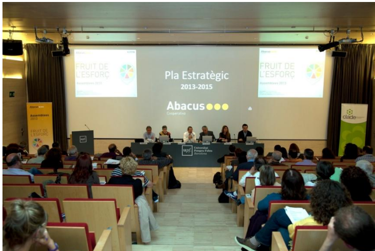
Assemblea General 2013