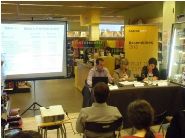
Ass. preparatòria de socis i sòcies de consum a Reus